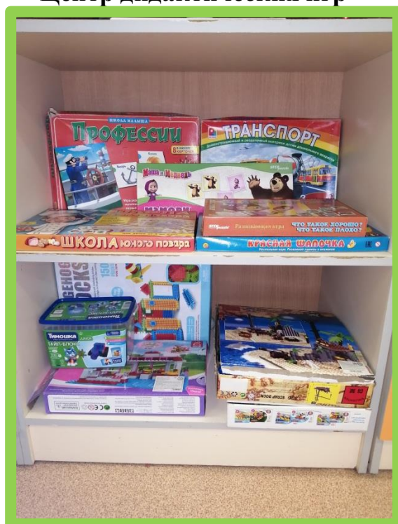
Центр дидактических игр