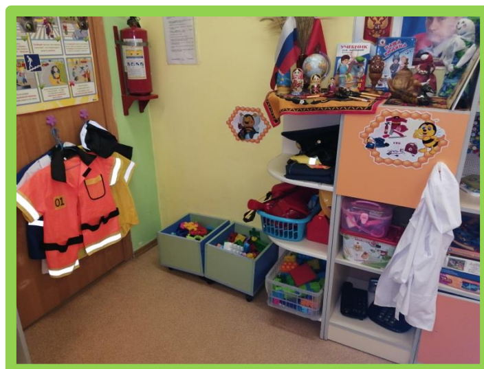
Больница, пожарная служба, такси, почта, полиция, морская служба