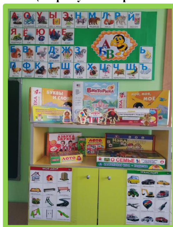
Центр обучения грамоте